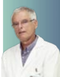
MICHEL VLEUGELS GYNAECOLOGIE